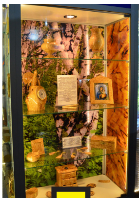
КАРЕЛЬСКАЯ БЕРЕЗА ПРОДАЕТСЯ НЕ КУБОМЕТРАМИ, А КИЛОГРАММАМИ.