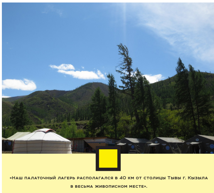
«НАШ ПАЛАТОЧНЫЙ ЛАГЕРЬ РАСПОЛАГАЛСЯ В 40 КМ ОТ СТОЛИЦЫ ТЫВЫ Г. КЫЗЫЛА В ВЕСЬМА ЖИВОПИСНОМ МЕСТЕ».

«Кызыл – Курагино» – это нечто большее, чем просто экспедиция, это новая страничка в жизни каждого ее участника, новые эмоции, новые впечатления, новые знакомства... Для каждого из нас это была маленькая сказка, которая длилась один месяц. И, как сказал один из волонтеров, «мы оставили частичку своей души в этой экспедиции».