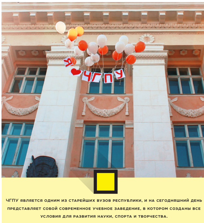
ЧГПУ является одним из старейших вузов республики, и на сегодняшний день представляет собой современное учебное заведение, в котором созданы все условия для развития науки, спорта и творчества.

Новоиспеченных студентов поздравила член Комитета Совета Федерации по науке, образованию и