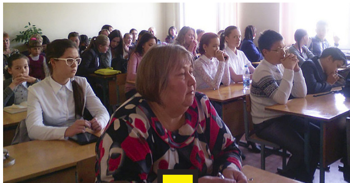
Пожалуй, главным подарком для всех стало чувство единения и исполненного долга памяти перед теми, кто защищал наш мир.