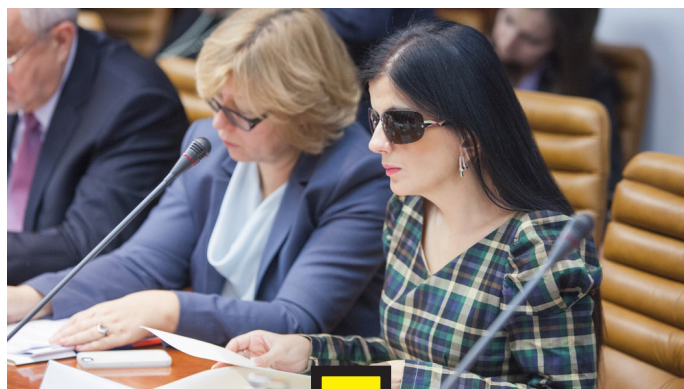
Диана Гурцкая является Президентом попечительского совета Благотворительного фонда помощи неизлечимым детям «По зову сердца» и членом Общественной палаты Российской Федерации. Ее выступление затронуло всех своей искренностью и трепетностью, особым вниманием к проблеме детей-инвалидов.

вания. Это инновационные модели организации образовательной среды для детей с ограниченными возможностями здоровья, специальные информационные технологии, позволяющие организовать дистанционное образование детей с ограниченными возможностями здоровья, наличие научно-образовательной инфраструктуры, высококвалифицированных специалистов и положительного опыта государственных организаций и общественных объединений. Активно развиваются инклюзивные формы и технологии обучения детей с ограниченными возможностями здоровья. Созданы Республиканский центр дистанционного образования детей с ограниченными возможностями здоровья и Ресурсный центр сопровождения