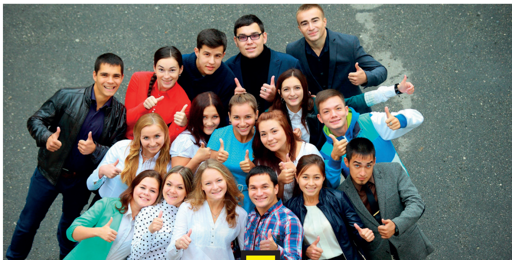
Студконгресс объединяет несколько организаций: студенческую службу безопасности, студенческий сервисный отряд, информационно-аналитический центр, координационный совет студдеканов, центр студенческого самообразования.

- Дружная команда. Когда я пришел, то в команде были в основном девушки. А я помню, что на одной из школ актива нам говорили, что в коллективе активистов должен быть гендерный баланс. Я стал привлекать в актив побольше деятельных парней. Получилось. Пришли, остались. Сейчас это сплоченная команда, и они доверяют друг другу, активно работают. Например, по итогам прошлого года мы были единственным вузом, который принял участие во всех мероприятиях Центра молодежных инициатив. Итоги этого