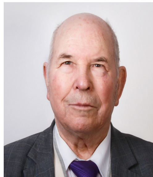
Анисимов Г. А.

Инженерно-технологической академии ЧР (1994), действительный член Международной академии наук педагогического образования (1999), заслуженный деятель науки РФ (2001), действительный член Академии наук ЧР (2008), лауреат Государственной премии ЧР в области гуманитарных наук (2012).