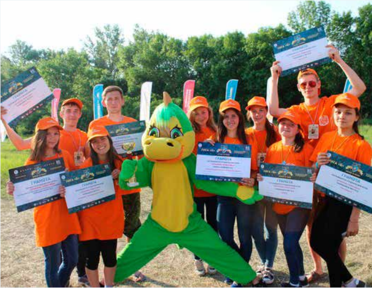
Дебют команды ЧГПУ им. И.Я. Яковлева стал удачным. Ребята заняли четвертое общекомандное место и получили семь личных кубков