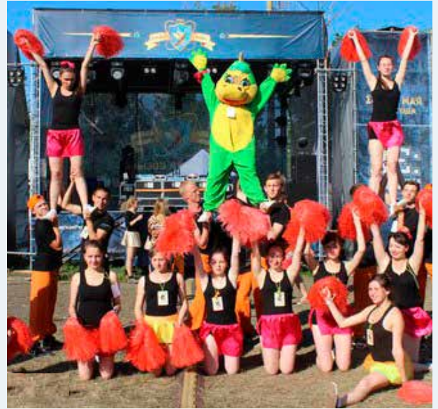
Это совсем другой мир – мир дружбы, взаимопонимания, взаимопомощи, поддержки, улыбок, позитива.

ла отличную игру, уступив лишь опытной команде «Платовцы». Ребята играли очень слаженно, благодаря чему смогли завоевать серебро.