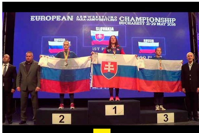
«Для меня очень важна поддержка остальных участников команды. Например, на чемпионате России мне очень помогли участницы команды Чувашии.»

— Как-то еще в школе я попала на соревнования к старшей сестре, которая занималась этим видом спорта в Кугесьской СОШ № 1. Мне очень понравилось, начала заниматься. Сестра после окончания школы забросила, а я не смогла. Тренировалась под руководством Ива-