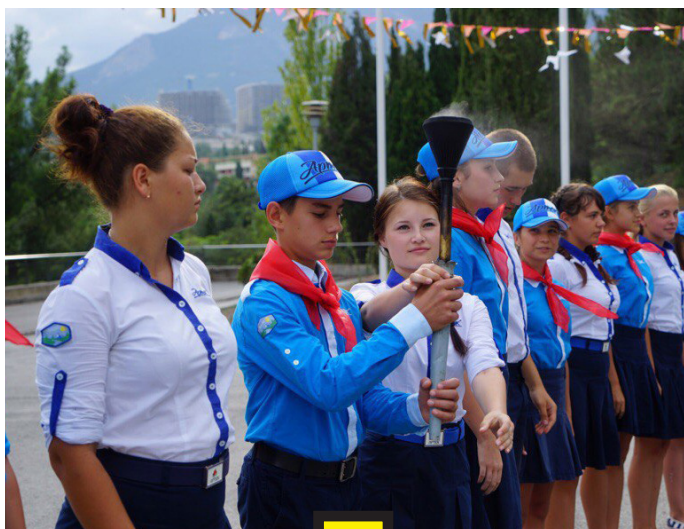
«ЛАГЕРЬ НАПОЛНЕН ТРАДИЦИЯМИ И НЕОБЫКНОВЕННЫМИ ОБРЯДАМИ. НАПРИМЕР, ТАМ МОЖНО В СПЕЦИАЛЬНЫХ МЕСТАХ ЗАГАДАТЬ ЖЕЛАНИЕ, И ОНО ОБЯЗАТЕЛЬНО СБУДЕТСЯ.»