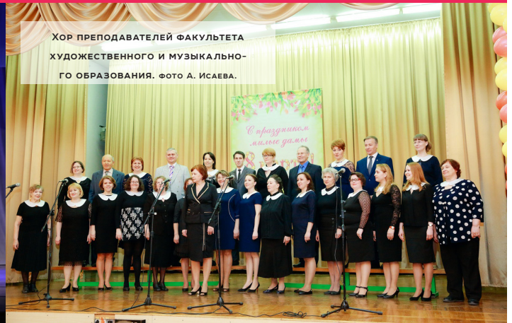
ХОР ПРЕПОДАТЕЛЕЙ ФАКУЛЬТЕТА ХУДОЖЕСТВЕННОГО И МУЗЫКАЛЬНО- ГО ОБРАЗОВАНИЯ.