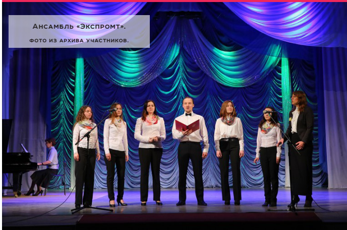
АНСАМБЛЬ «ЭКСПРОМТ».