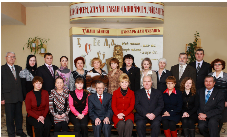
«АслӀ сӀутавсӀмӀр И. Я. Яковлев халалланӀ пек вӀренӀр, ӀмӀр кӀрешӀр. ТӀван халӀхӀмӀртан тухнӀскерсем, унӀн сӀутӀ пуласлӀхӀшӀн, ырлӀх-телейӀшӀн сӀнса пурӀнӀр!»

ЧӀваш чӀлхесӀсемпе сӀмахсӀсен сав сулсенче пасар пурнӀсӀе суратнӀ чӀрмӀвсемпе йыварлӀхсене ытларах хӀйсем тӀллӀн, сӀрӀплӀхӀпе чӀтӀмӀлӀх кӀтартса сӀнтересе пыма тиврӀе.