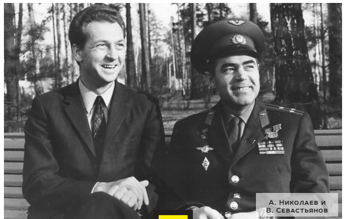
А. НИКОЛАЕВ И В. СЕВАСТЬЯНОВ

Второй полет был длительным – 424 часа 59 минут, с 1 по 19 июня 1970 г. НИКОЛАЕВ УЧАСТВОВАЛ В ПОЛЕТЕ В КАЧЕСТВЕ КОМАНДИРА КОСМИЧЕСКОГО КОРАБЛЯ «СОЮЗ-9» СОВМЕСТНО С В.И. СЕВАСТЬЯНОВЫМ.