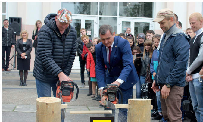
ОКАЗЫВАЕТСЯ, РЕКТОР ПЕДАГОГИЧЕСКОГО УНИВЕРСИТЕТА ДАВНО ДРУЖИТ С ЭТИМ ИНСТРУМЕНТОМ.

В проекте приняли участие известные мастера из Ямало-Ненецкого автономного округа, Челябинской области, Санкт-Петербурга, Республики Марий Эл, г. Тольятти. Чувашию на фестивале представили кан-