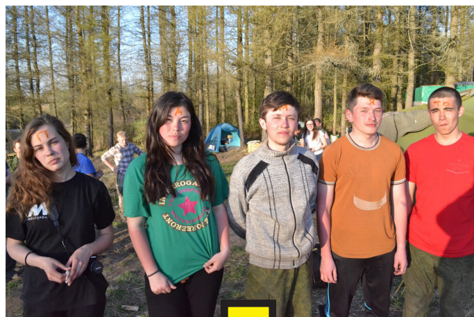
НОВЫЕ БОЙЦЫ ОТРЯДА.

Понятно, что в условиях тяжелых боев просто не было возможности накладывать солдатам гипс. Трудно представить, какие мучения переносили красноармейцы, идя в бой с переломанными костями. Только один этот факт убеждает нас в том, что память о них надо хранить и передавать из поколения в поколение.