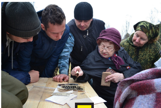
ВСТРЕЧА С УРОЖЕНКАМИ ДЕРЕВНИ ВОРОНОВО.

«Мы понимаем, что в этих местах все уже перекопано, но, тем не менее, каждый год поднимаем останки. Работать здесь нужно как можно тщательнее, и с каждым годом наша методика работы только совершенствуется. Мы стараемся использовать новые архивные материалы, новые методы. Когда откапываем останки бойца, иногда видим его последнюю позу, додумываем, что с ним происходило, что он переживал. Мы владем знаниями в области физической антропологии и можем по костям, например, определить болезни и патологии бойца, возраст, неправильно сросшиеся после перелома кости и т. п.