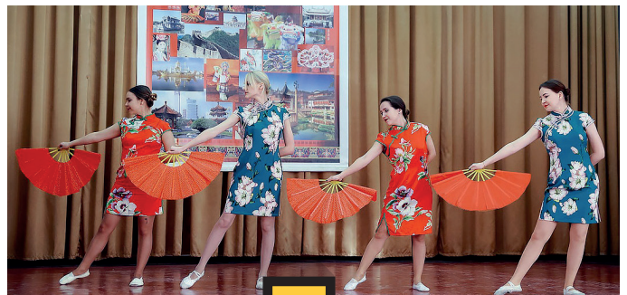
«С КИТАЙСКИМИ ТАНЦАМИ ВЫСТУПИЛИ СТУДЕНТЫ ФАКУЛЬТЕТА ИНОСТРАННЫХ ЯЗЫКОВ, ТАНЦЕВАЛЬНАЯ ГРУППА КУГЕСЬСКОЙ ДЕТСКОЙ ШКОЛЫ ИСКУССТВ.»