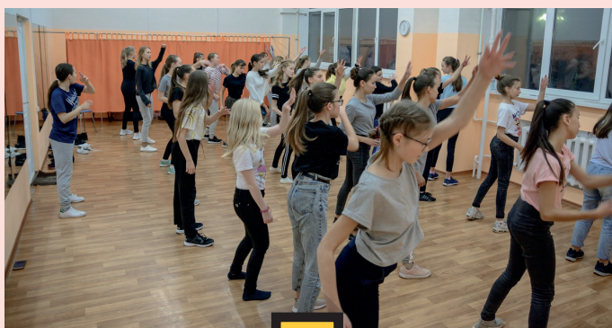
«В ФЕВРАЛЕ У НАС ОТЧЕТНЫЙ КОНЦЕРТ, ЗАНИМАЕМСЯ ПОДГОТОВКОЙ К НЕМУ. НАШЕ ОСНОВНОЕ НАПРАВЛЕНИЕ – УЛИЧНЫЕ ТАНЦЫ: ПАППИНГ, ХИП-ХОП, ЛОКИНГ.»

- А вы всех берете или есть какой-то отбор?