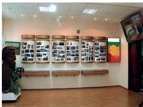
« В МУЗЕЕ СОСРЕДОТОЧЕНЫ ЛИЧНЫЕ АРХИВЫ ВОСПИТАННИКОВ СИМБИРСКОЙ ЧУВАШСКОЙ УЧИТЕЛЬСКОЙ ШКОЛЫ И КРУПНЕЙШИХ УЧЕНЫХ. »

На основе музейных фондов создаются постоянные экспозиции и выставки. Основной формой работы музея являются экскурсии. Они проводятся с разнообразными группами: воспитанниками детских садов, учащимися школ, студентами средних профессиональных и высших учебных заведений, аспирантами, учителями, сотрудниками различных учреждений, ветеранами труда и др. В основном проводятся обзорные экскурсии, практикуется также проведение тематических экскурсий («Воспитанники Симбирской чувашской учительской школы – поэты и писатели», «Эколо-