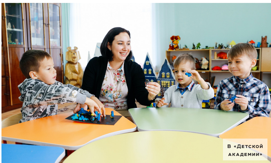
В «ДЕТСКОЙ АКАДЕМИИ»