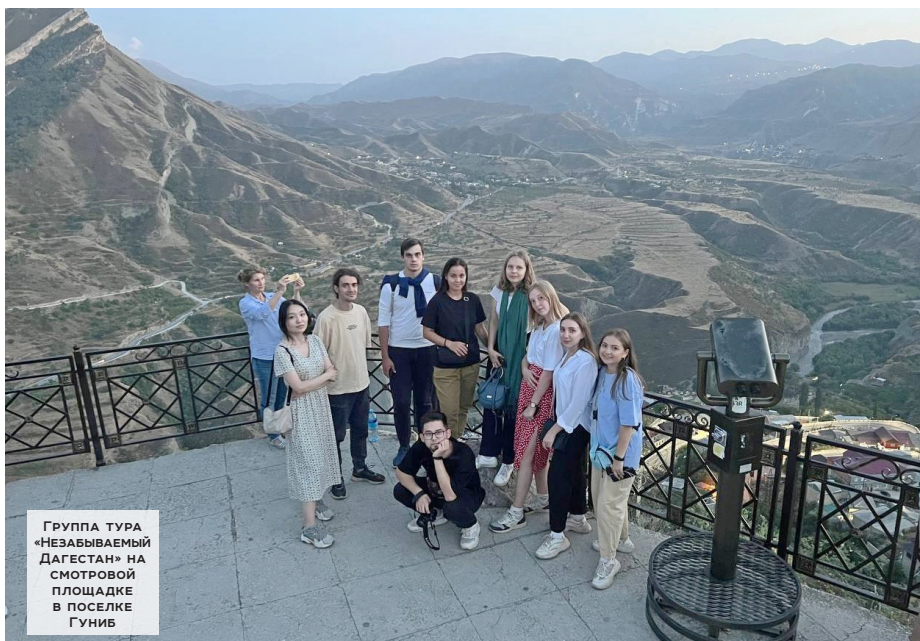
Группа тура «Незабываемый Дагестан» на смотровой площадке в поселке Гуниб

Дмитрий: Благодаря ей мы узнали, как живут люди в селениях и городах республики. Она общалась с местными жителями на аварском языке – это один из распространенных языков Дагестана (а всего там более 120 диалектов, 40 языков, из них 14 – официальных). Было очень интересно слышать этот необычный язык и знакомиться с национальными особенностями