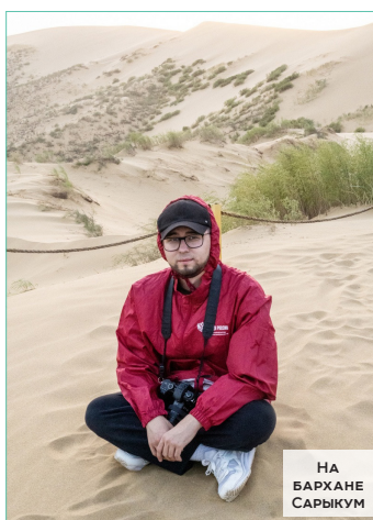
НА БАРХАНЕ САРЬКУМ

Бархан Сарькум известен прежде всего тем, что здесь снимали знаменитый фильм «Белое солнце пустыни». Ученые мира до сих пор не пришли к единому мнению, каким образом в нескольких десятках километров от Махачкалы появился кусок пустыни. По их предположению, бархану как минимум несколько сотен тысяч лет. Он признан крупнейшим в Европе. Его абсолютная высота – 262 метра, площадь – почти 600 гектаров. Полюбоваться в полной мере окрестностями с его высот нам не удалось, так как в тот день стояла очень ветренная погода