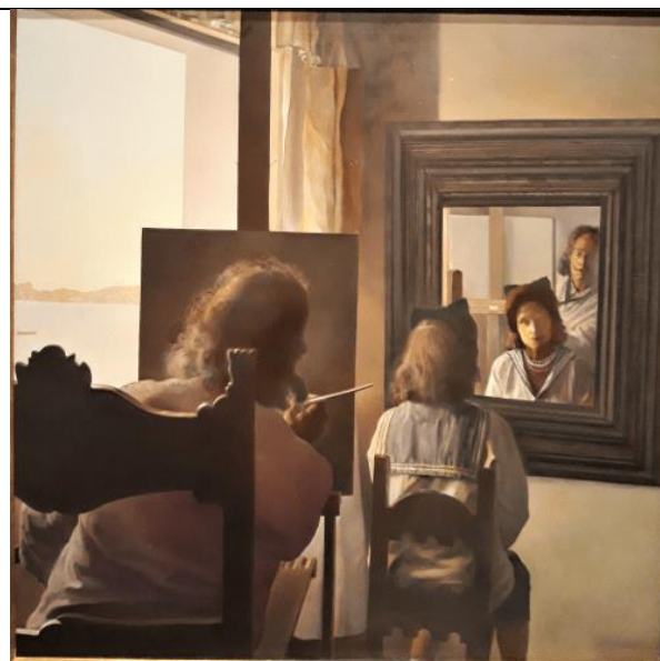
Сальвадор Дали. Дали со спины, пишущий Галя со спины

Изображение человека спиной к наблюдателю представляет собой феномен, довольно редко встречаемый в истории искусств. Подумайте, почему художники выбирают данный образ. Для этого проанализируйте каждую картину в историко-социальном контексте. Объем представляемого текста – до 3000 знаков.