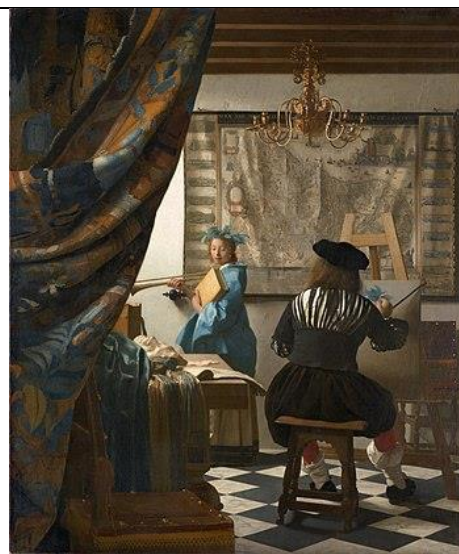
Ян Вермеер. Аллегория живописи