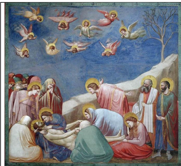
Джотто. Оплакивание Христа. Фреска